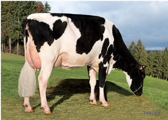
MS HH PACE ATLANTA DAM