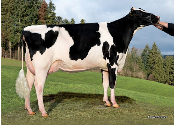
MS HH PACE ATLANTA DAM