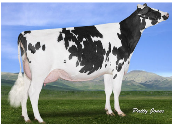
GOLD-N-OAKS MVP ARIA2815 THIRD DAM